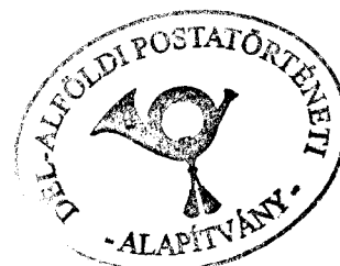
Tóth László kuratórium elnöke