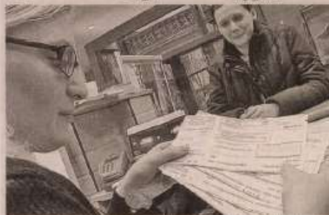
A megyében 27 postahivatal szolgáltatásait adná ki vállalkozóknak.

hogy az állam szabadulna a veszélyes postahivataloktól, de szerinte nem szabad elfelejteni, hogy a községekben a tényleges feladatuknál jóval összetettebb és fontosabb szerepet játszanak ezek az intézmények. A polgármester szerint a falu érdeke a jelenlegi rendszer megmaradása lenne.