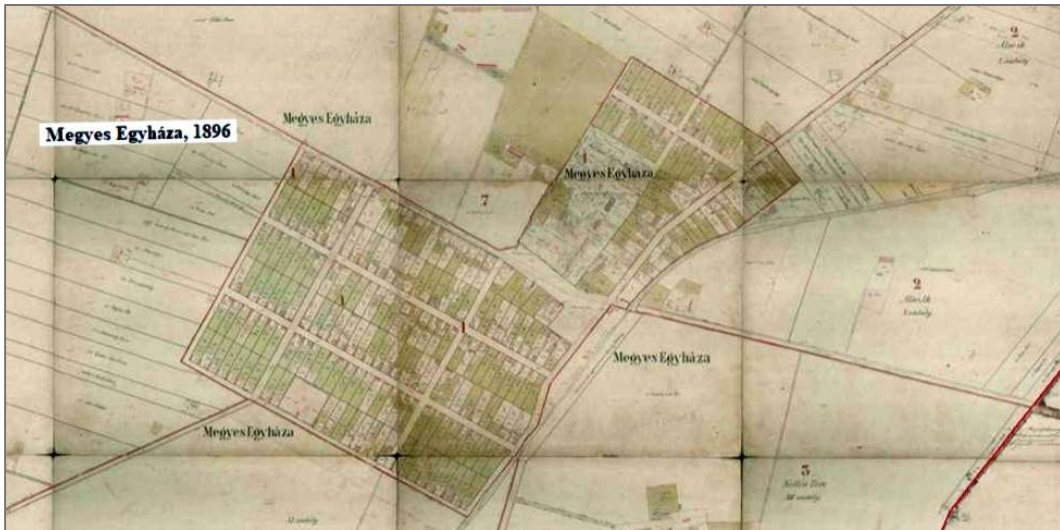
Térképrészlet: Medgyes Egyháza 1896-ban a Habsburg Birodalom kataszteri térképén. (Arcanum térképek)

alakult át. Az új községnek Medgyes-Egyháza a neve, s Medgyes-Bodzás nagyközséggel külön körjegyzőséggé egyesült.” 3