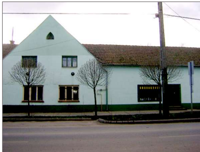
A postakocsi csárda épülete 2015-ben.

A vasút fokozatosan feleslegessé tette a lovas postakocsival utazást, így idővel megszűnt az egykori postakocsi-állomás szerepe és jelentősége. Postára azonban egyre nagyobb szüksége volt a fejlődő településnek, de más formában.