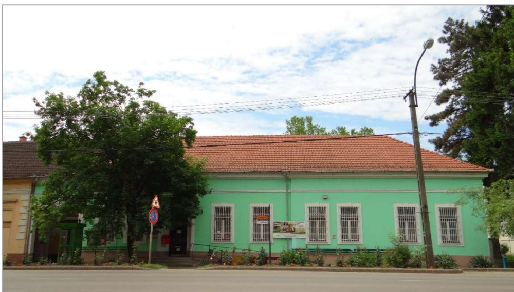
A posta épülete 2015-ben.

2006-ban az épületet teljes egészében felújították, új korszerű berendezésekkel, biztonsági eszközökkel, akadálymentesítéssel látták el.