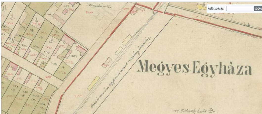
A fenti térkép kinagyított részletén jól látható a vasút az állomásépületekkel (Arcanum térképek)

1899-ben Medgyes-Egyházát is nagyközséggé nyilvánították. 4 1950-ig nagyközség volt, a tanácsrendszerben pedig előbb önálló tanácsú község, majd 1971-től ismét nagyközség. 2009-ben városi rangot kapott.