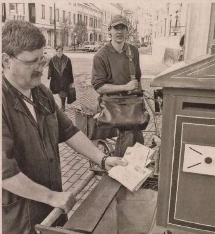
Eltűnnek a régi levelezéskények. Békéscsabán ebben az évben huszonöt új típusú postaládát telepítenek.